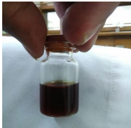
Gambar 1. Foto Hasil Ekstraksi Kulit Kakao

Serbuk kulit kakao yang telah diekstraksi dengan metode maserasi menggunakan etanol 98% sebagai pelarut, pelarut tersebut akan menarik senyawa sesuai kepolarannya. Proses maserasi dilakukan selama 24 jam hingga larutan hasil ekstraksi jernih yang menandakan sudah tidak ada senyawa lagi yang dapat diekstrak oleh pelarut tersebut. Hasil ekstraksi yang diperoleh dilakukan pengujian secara organoleptis dan menguji kadar pelarut yang masih tertinggal dalam ekstrak. Uji organoleptik secara visual meliputi pemeriksaan bentuk, warna, dan bau dari ekstrak kulit kakao. dapat dilihat pada Gambar 1.