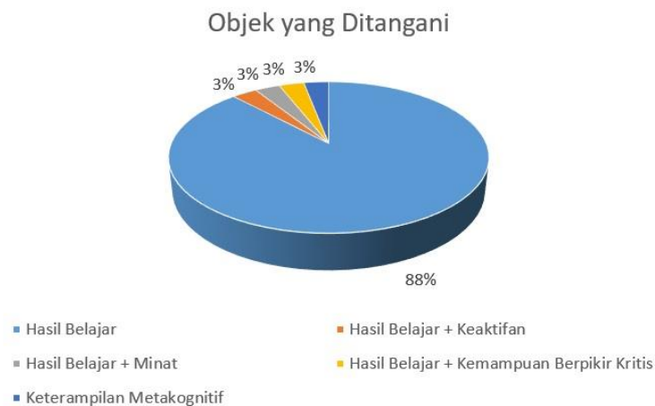
Gambar 1. Diagram Pie Persentase Objek yang Ditangani

Berikut ini disajikan data Penelitian Tindakan Kelas skripsi mahasiswa Jurusan Biologi, FMIPA, UNIMA berupa beberapa grafik berkaitan dengan objek yang ditangani (Gambar 1), tingkat pendidikan yang menjadi subjek penelitian (Gambar 2), tindakan yang dilakukan (Tabel 1), dan tahun penelitian (Gambar 3).