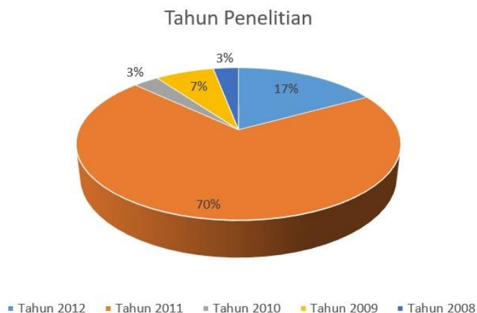
Gambar 3. Diagram Pie Tahun Pelaksanaan Penelitian